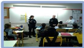
Nous tenons à remercier les policiers du Commissariat Central de l'embouchure pour le temps qu'ils nous ont accordé ainsi qu'à tous les policiers pour leur travail et leur dévouement

Le lieutenant nous a dit que les policiers mangent équilibrés et de façon régulière. Leur métier leur impose une bonne condition physique pour pouvoir intervenir et entrer dans les équipements. Ils nous ont donc conseillés de manger équilibré, sans sucre et de boire beaucoup d'eau.